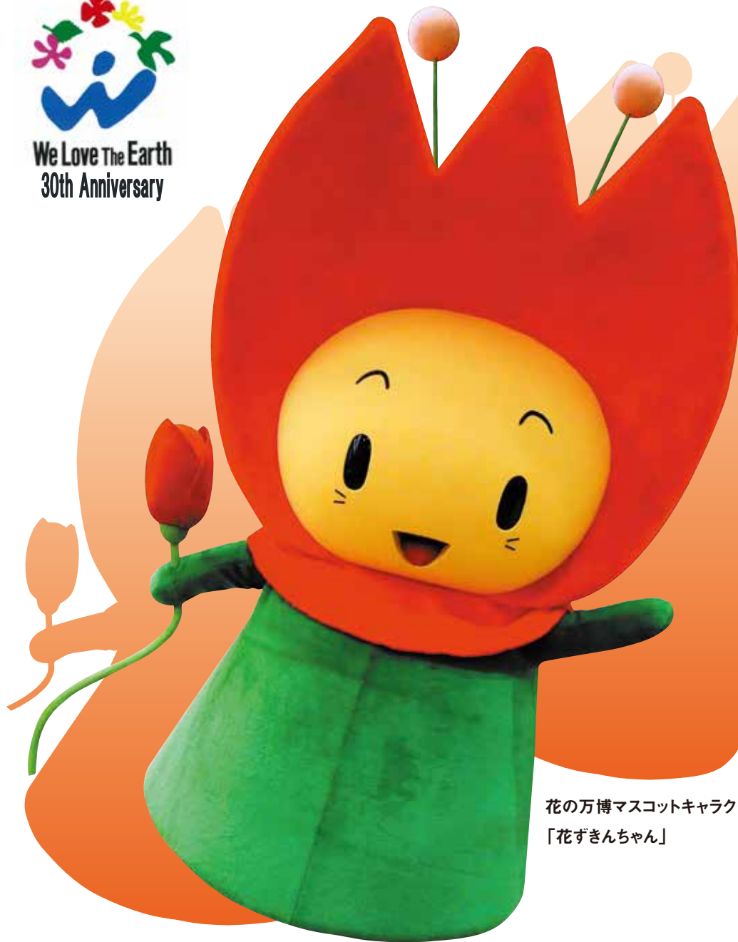
花の万博マスコットキャラクター 「花ずきんちゃん」