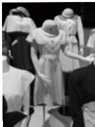
コンパニオンユニフォーム