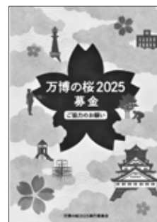
↑リーフレット表紙

万博の桜2025実行委員会事務局 TEL: 06-4400-8739 (受付時間 9:30~17:30) (公益財団法人国際花と緑の博覧会記念協会内) メール: sakura2025@expo-cosmos.or.jp